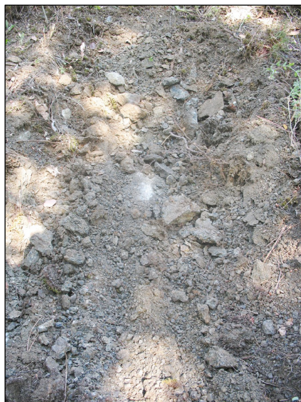
Dettaglio roccia rinvenuta a breve profondità.